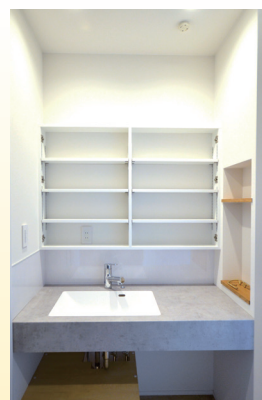
使える収納棚が配された 水まわりスペース